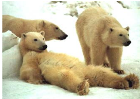
Arbeitsbuch Kapitel 2: Projekt-Planung – gemeinsam stark

Erst hatten sie noch eine Übertragung der Eisbär-Rangers gegen die Arktik-Devils gesehen, und plötzlich war es schon 2 Uhr morgens, und keiner hatte es gemerkt. „Looking“ und „Waiting“ waren sich seit 20 Minuten uneinig wer mit dem Lesen des ersten Kapitels beginnen sollte, als JeBo ganz klar wurde, wenn er jetzt nicht das Zepter in die Hand nahm, dann würde das nichts werden,